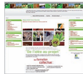
www.inpactpc.org Les pages « Foncier » du site donnent aux bénéficiaires un accès direct aux annonces.