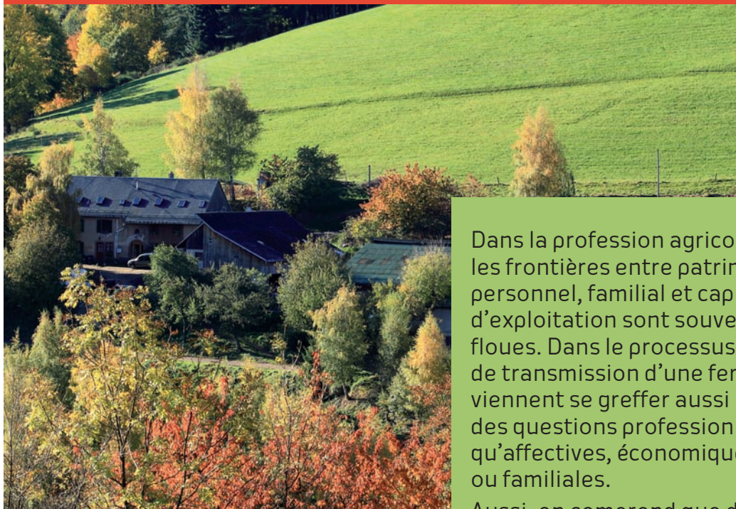
Ferme du Brezouard, Alsace

Dans la profession agricole, les frontières entre patrimoine personnel, familial et capital d'exploitation sont souvent floues. Dans le processus de transmission d'une ferme viennent se greffer aussi bien des questions professionnelles qu'affectives, économiques ou familiales.