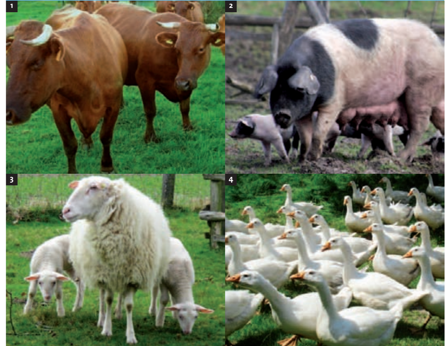
Abb. 1 Die Angler Rotvieh Kühe.