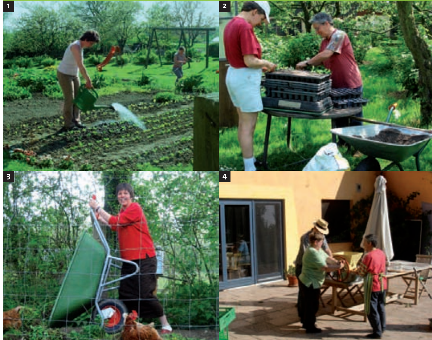
Abb. 1 Pflege des Kräutergartens.